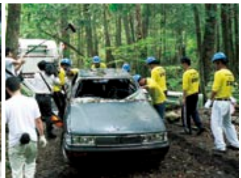
富士山の不法投棄清掃活動