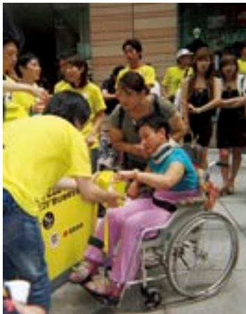
「24時間テレビ」の募金活動

また、日本テレビでは、若い世代に夢のある美しい地球を残すため、エコ活動へ積極的に取り組んでいます。毎年世界環境デーである6月5日にあわせて、「日テレECOウィークエンド」キャンペーンを開催しています。2006年は「ロハス(LOHAS)」を統一テーマに特別番組やイベントを通じて、楽しいエコロジーを広く呼びかけました。