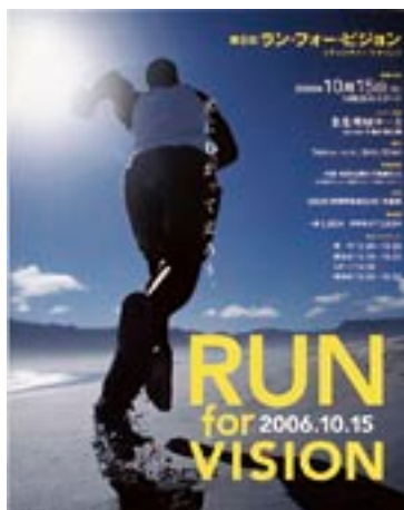
「ラン・フォー・ビジョン」は角膜移植及びアイバンク活動への理解を啓発するために開催するチャリティ・マラソン大会です。財団法人日本テレビ系列 愛の小鳩事業団はこの大会の後援をしています。