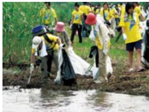
「びわ湖プロジェクト」